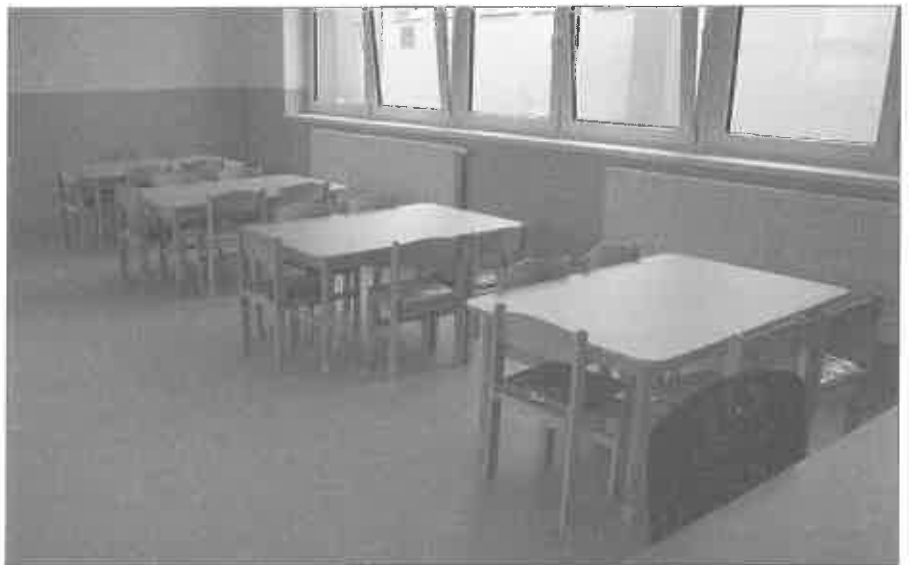
Novozriadená trieda Materskej školy v Trakoviciach

Realizáciou uvedenej investičnej akcie sme vytvorili priestor pre budúci rozvoj obce aj z hľadiska rozvoja bytovej výstavby, s čím priamo súvisí aj možné zvyšovanie počtu detí v materskej škole.