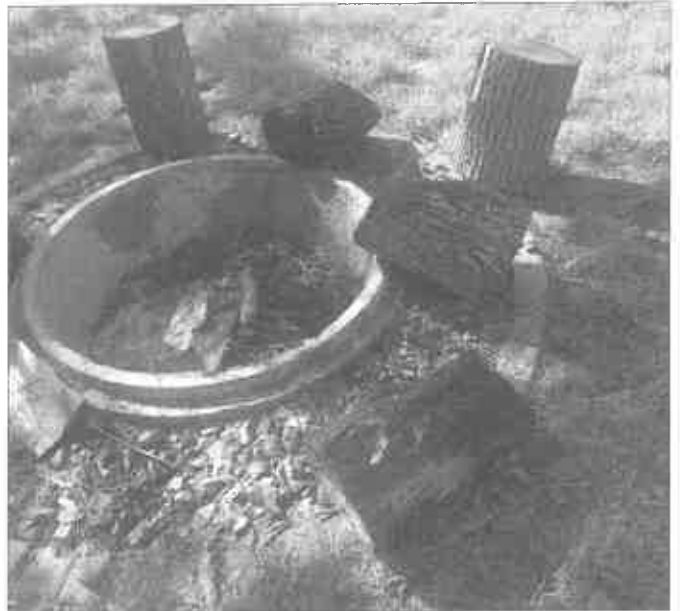
Popálené prútky „nepravými“ dobrovoľníkmi

Vzápätí sa objaví aj iní dobrovoľníci. Nazvime ich „nepravi“. Tí tiež len tak, z ničoho nič prídu. Celkom dobrovoľne vryjú ryhy do dreveného sedenia. Posprejú hmyzí domček, polámu kvety, vhodia do ohňa darované prútky. Trochu im krivdím, iba tri, tie ďalšie štyri niekto odnesie pre istotu domov, veď dubové drevo sa hodí do krbu – a zadarmo – no nekúp to! Ďalší zasa zaparkuje do čerstvo vysadenej trávy a zanechá po sebe škaredú hlbokú ryhu. Ďalší sa zastaví s celou rodinkou, aj s malými deťmi a miesto na lavičku si sadnú na stôl. Potom na