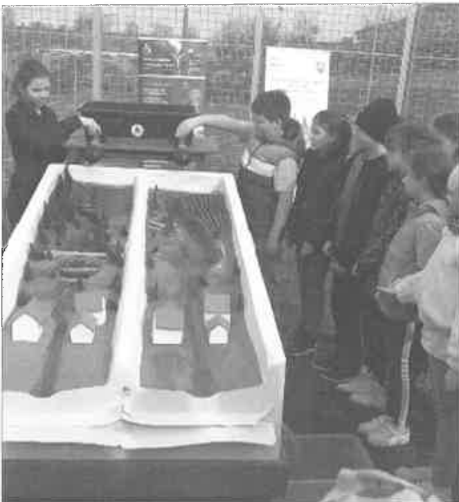
Voda pre klímu

– Mladší žiaci v rámci dopravnej výchovy absolvovali tréning na dopravnom ihrisku.