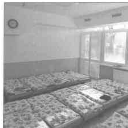
Pre detičky všetko nachystané

Tak ako sa pomaly končí kalendárny rok 2023, tak sa končia aj posledné stavebné úkony a úpravy priestorov novopostavenej triedy. Veríme, že tento priestor bude kreatívnym a plnohodnot-