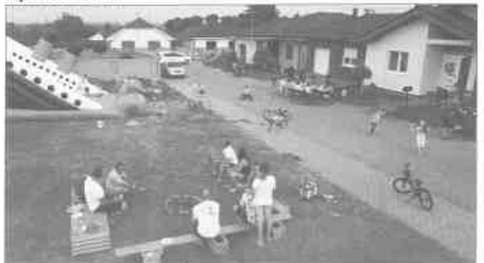
Naša Dolinková susedská komunita