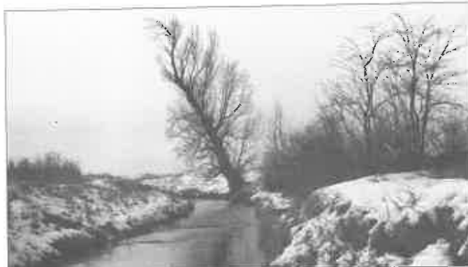
Topol od Žlkoviec

Keď spomeniete pred niektorým rodeným Trakovičanom (narodeným ešte v rokoch socializmu) v súvislosti s miestom na Dudváhu spojenie „pri lipy“, tak sa mu automaticky vybaví stav na Dudváhu, ktorý v minulom storočí vyrobili silnejší chlapi zo skál, kmeňov, koreňov stromov a balíkov slamy – asi v polovici úseku medzi žlkovským mostom a chotárnou hranicou s Trakoviciami (tvorí ju melioračný kanál). Stav slúžil na zvýšenie hladiny vody pre vynachádzavú a kúpaniachtivú mládež. V 19. storočí v týchto miestach fungoval mlyn na mle-