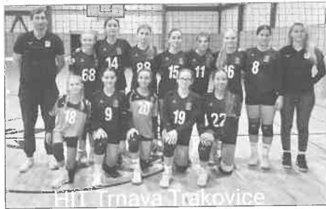
Úspešné družstvo HIT Trnava – Trakovice na turnaji v Trakoviciach