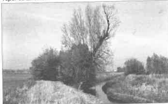
Topol pri Dudváhu