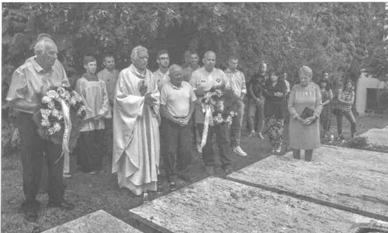
Mužstvo FTC Trakovice v sezóne 2023/2024