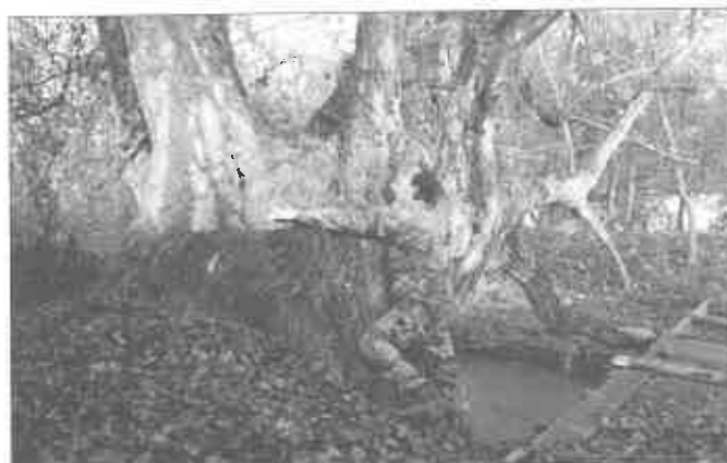
Topoľ čierny, obvod 720 cm, 2023

tie obilia a patril majiteľom vanigovského ospodárstva. A asi 50 – 100 m odtiaľto hore po prúde Dudváhu rastie strom, ktorý sme všetci inštinktivne nazývali lipou, hoci to ani lipa nie, ale topoľ. Konkrétne topoľ čierny ( Populus nigra ). Pred cca 40 rokmi rástol tento ikonický topoľ na brehu Dudváhu možno nejaké 2 m od vody a už vtedy jeho obvod kmeňa vzbudzoval úctu. Pre-