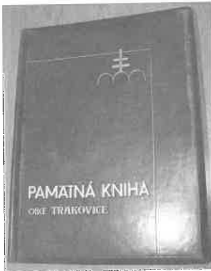
Pamätná kniha obce Trakovice z roku 1934