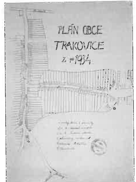
Plán obce Trakovice z roku 1934