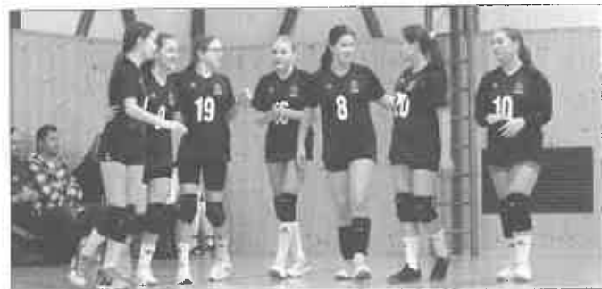
Družstvo HIT Trnava – Trakovice