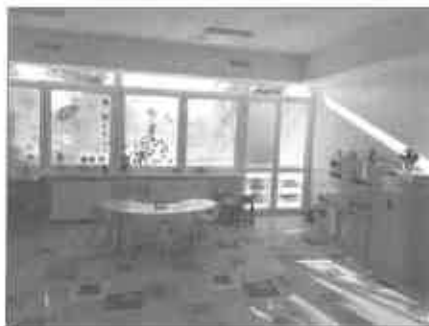
Útulná nová trieda

V neposlednom rade by sme chceli poďakovať rodičom detí, ktorí svojou prácou a usilovnosťou prispeli k tomu, že materská škola bola 4. 9. 2023 otvorená v riadnom termíne. Taktiež ďakujeme rodičom detí, ktoré už nenavštevujú našu