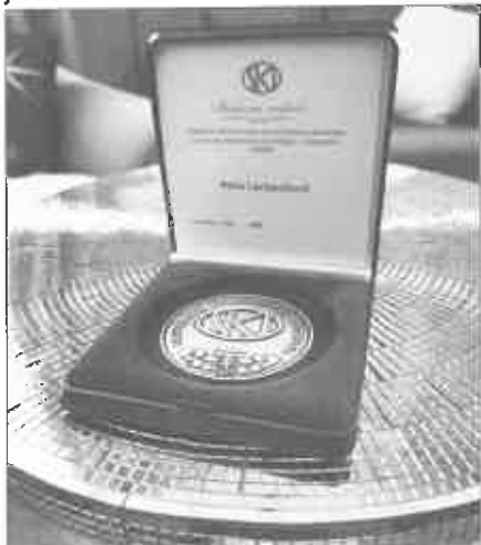
Strieborná medaila SKJ v kategórii Chov

Chovatelia psov na Slovensku – kynológovia, ktorí sa venujú chovateľstvu, výstavám, výcviku a kynologickým športom, sú zastrešení pod Slovenskou kynologickou jednotou – SKJ.