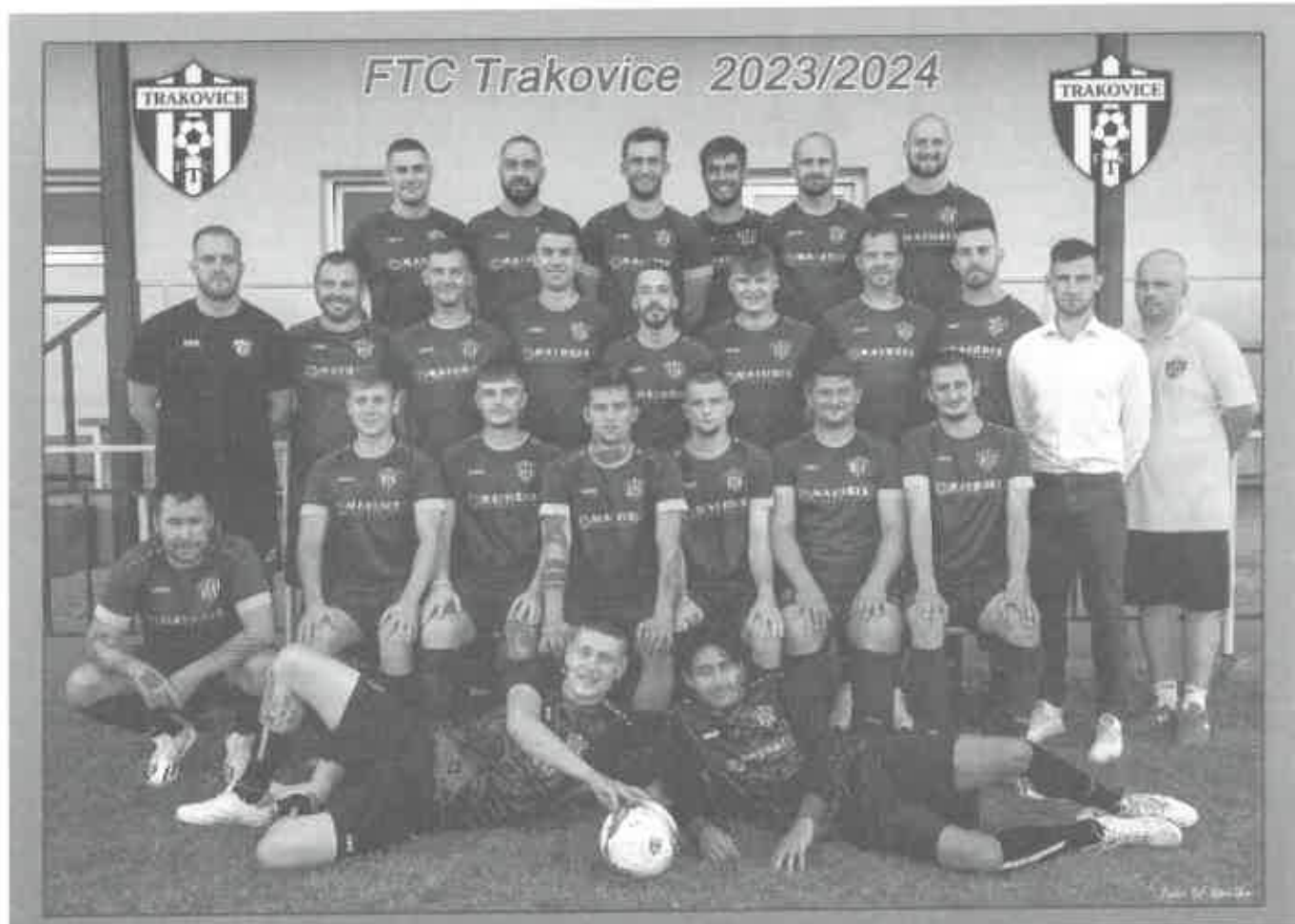
Mužstvo FTC Trakovice v sezóne 2023/2024