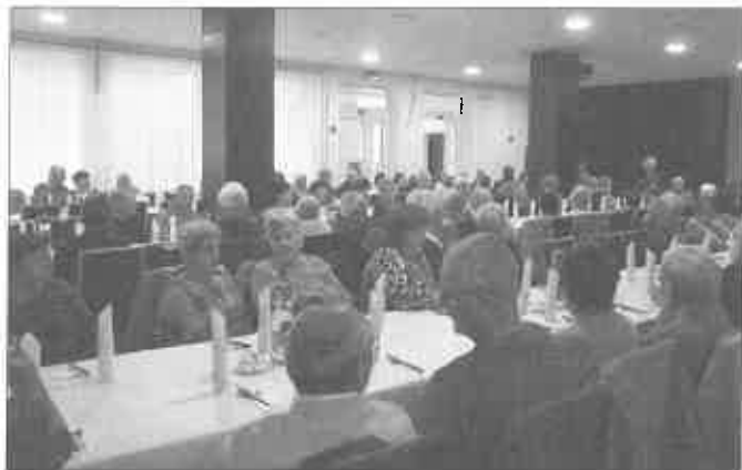
Úcta k starším - posedenie

urobili. Ani v tom náročnom období korony ste na nás nezabudli. Nemohli sme sa stretávať, ale darčeky sme dostali domov. ĎAKUJEME!