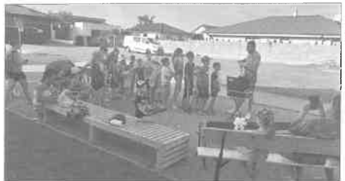
A prišiel kúzelník

O chvíľu je tu koniec kalendárneho roka a nás čaká ešte spoločné varenie silvestrovej kapustnice, poďakovanie za končiaci