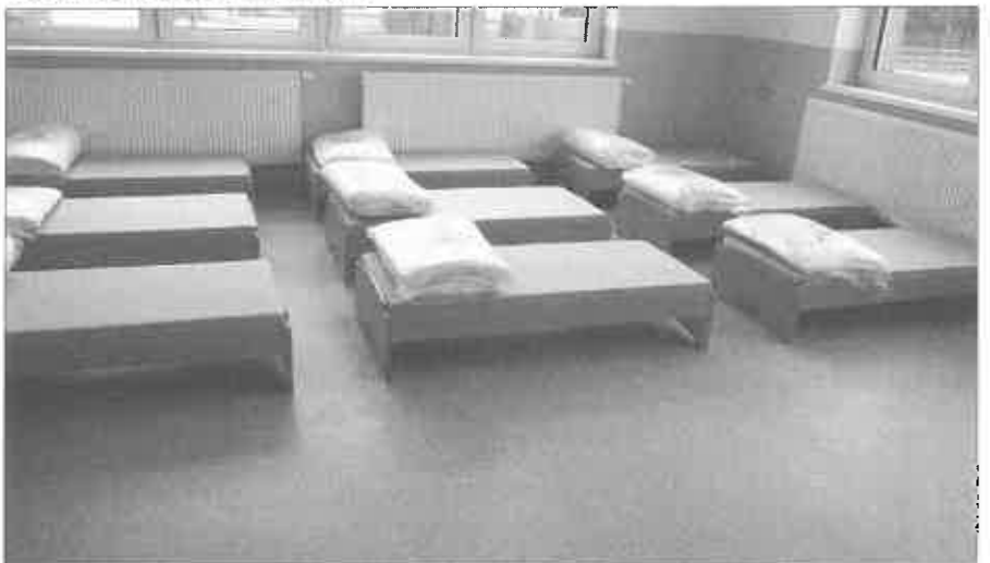
Nová ubytovacia časť Materskej školy v Trakoviciach