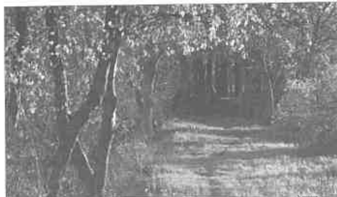
Citlivé úpravy vegetácie na Dudváhu