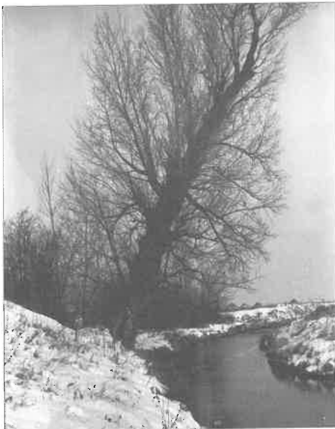
Topoľ od Trakovíc, 1979

tie obilia a patril majiteľom vanigovského ospodárstva. A asi 50 – 100 m odtiaľto hore po prúde Dudváhu rastie strom, ktorý sme všetci inštinktivne nazývali lipou, hoci to ani lipa nie, ale topoľ. Konkrétne topoľ čierny ( Populus nigra ). Pred cca 40 rokmi rástol tento ikonický topoľ na brehu Dudváhu možno nejaké 2 m od vody a už vtedy jeho obvod kmeňa vzbudzoval úctu. Pre-