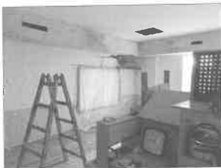
Príprava novej triedy MŠ

S blížiacim sa koncom roka 2023 sa tiež pozeráme späť a hodnotíme činnosť materskej školy. Do prvého ročníka zá-