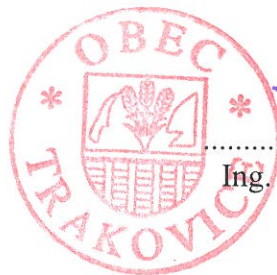
Ing. Ľudovít Tolarovič starosta